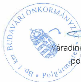
Váradiné Naszályi Márta polgármester