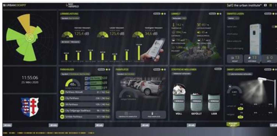
Urban Pulse városi adatplatform megjelenítő felület (minta)

A városi adatplatform célja, hogy a fentiekben megjelölt különböző forrásból érkező mérési információk, városi adatok egy központi felületen kerüljenek megjelenítésre. A felület képes az aktuális és a historikus adatok megjelenítésére is. Más adatforrások és más rendszerekből származó adatok is később megjeleníthetők a felületen (egyedi fejlesztés révén).