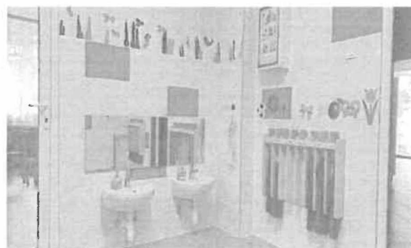
Iskola bölcsőde – fűrésztő felújítás (2023)