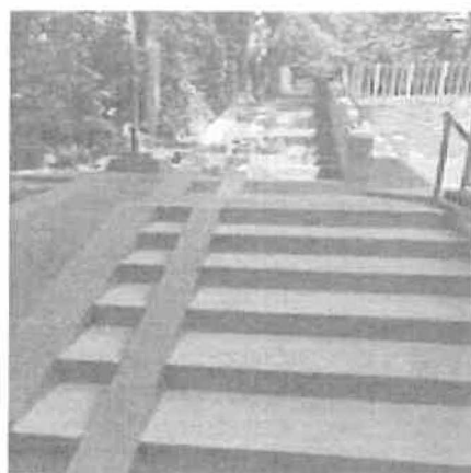
Tigris bölcsőde – felújított külső lépcsősor