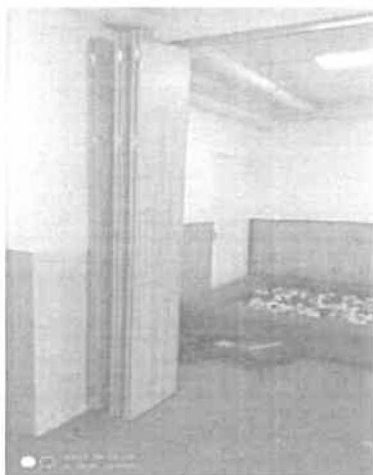
Iskola bölcsőde – új tornaszoba