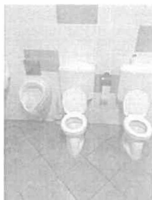
Iskola bölcsőde – fűrésztő felújítás (2)