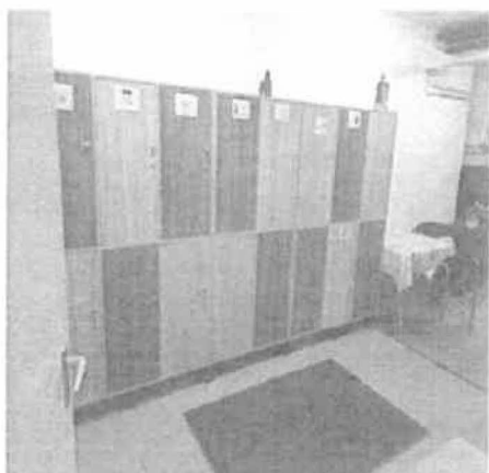
Tigris bölcsőde – új öltözőszekrények