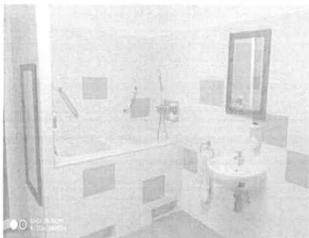
Iskola bölcsőde – fűrésztő felújítás